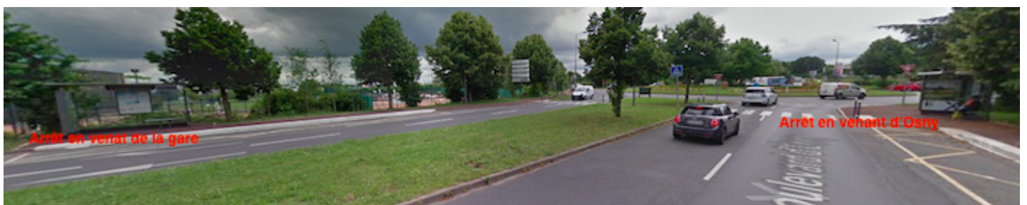
Arrêt venant de la gare de St Christophe

Prendre le bus 44 ou 34N et suivre la direction de Decathlon - Koezio. Descendre à l'arrêt Epine Martin. L'Aren'ice est à 10 mn à pieds.